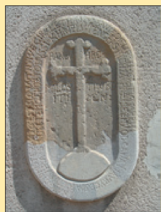
Křížový kámen na zdi hotelu připomíná vraždu v roce 1613.

V době svého rozkvětu býval Krumlov jedním z nejkrásnějších moravských měst. Kromě požárů a drancování vojáků ve středověku město poznamenalo i bombardování Rudou armádou 7. května 1945. Zasaženo bylo téměř 340 domů a zničena řada historických památek.